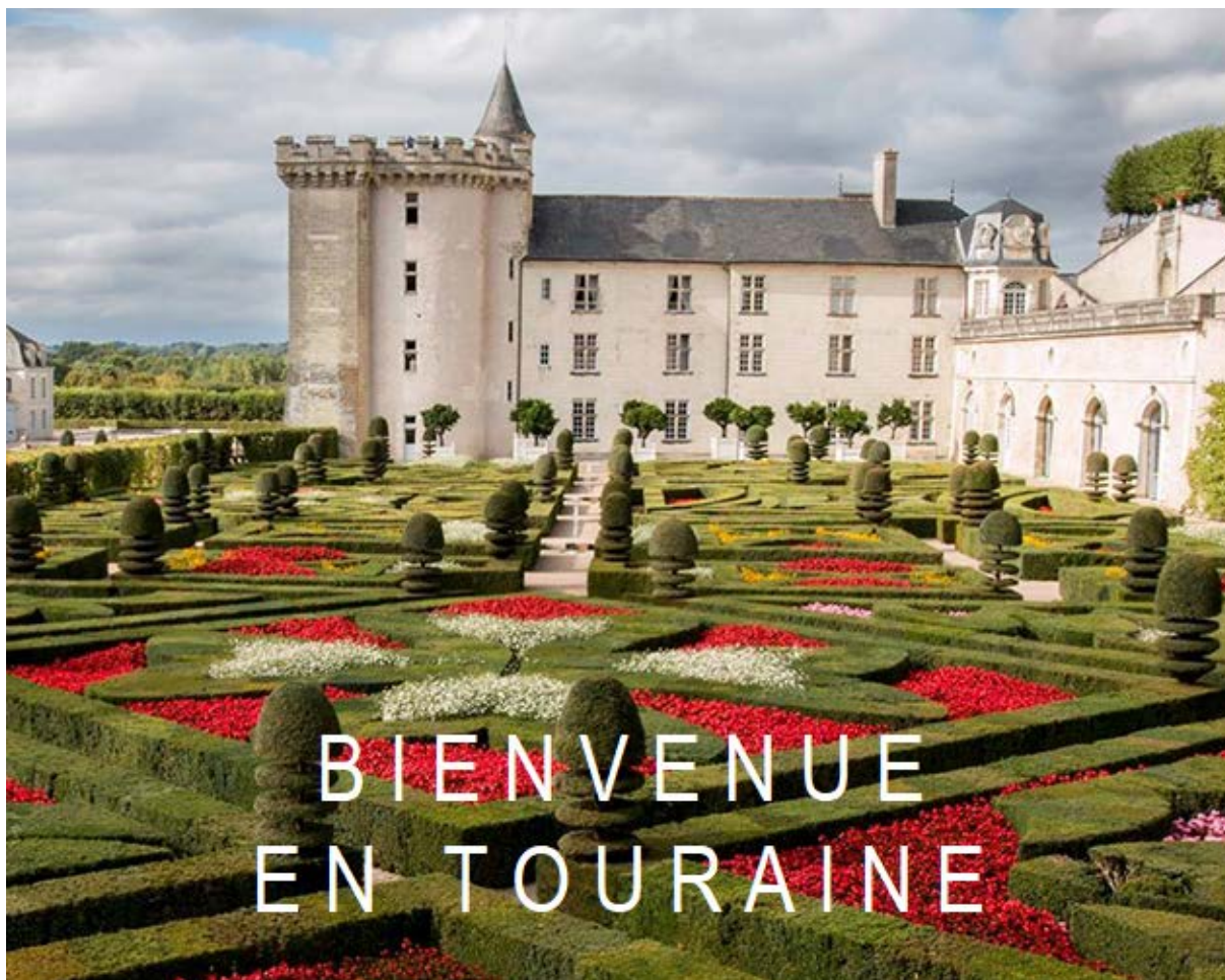
Château de Villandry

Tours – Val de Loire du 6 octobre au 9 octobre 2021